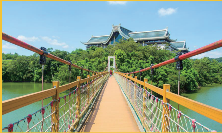
細茅埔吊橋 細茅埔吊り橋