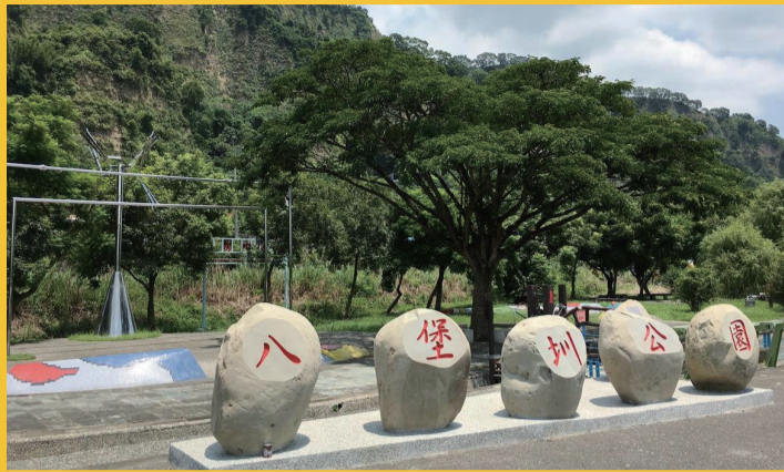
八堡圳公園 八堡圳公園